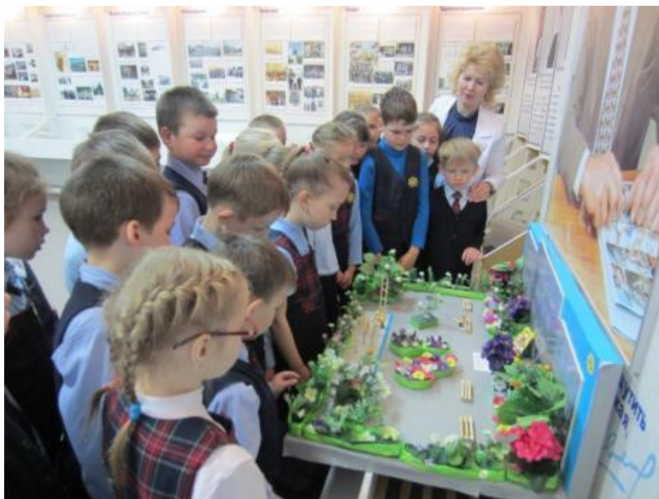
Учащиеся 1Б класса на экскурсии в школьном музее