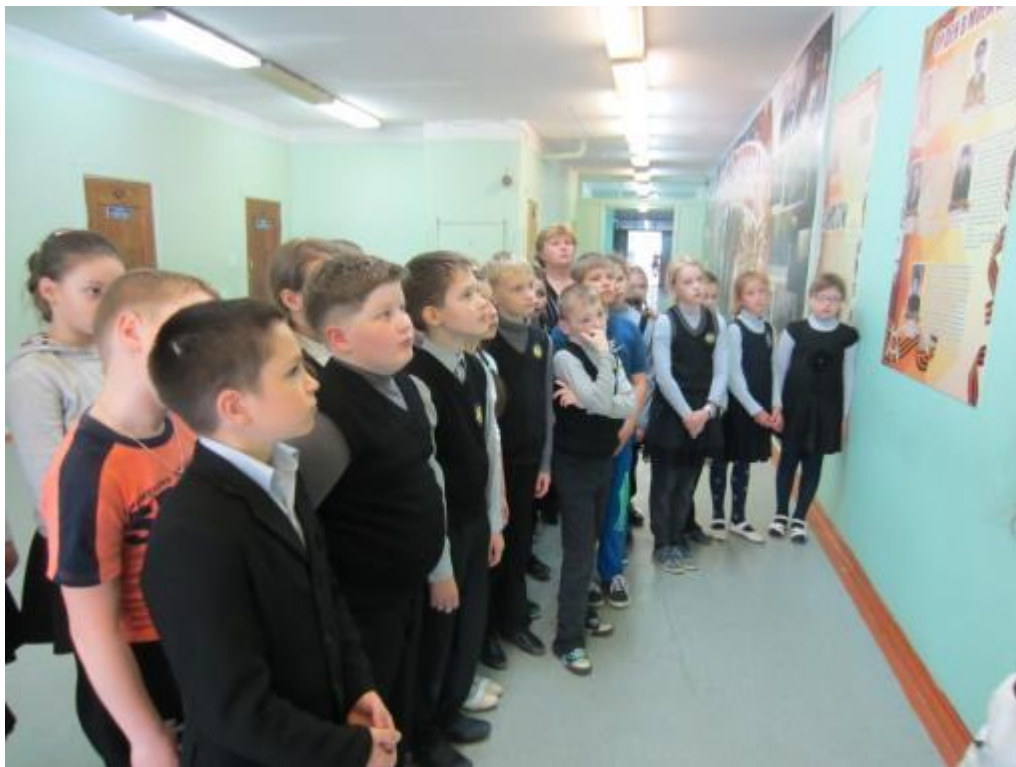
Учащиеся 3А класса на экскурсии по экспозиции «Салют, Победа!»