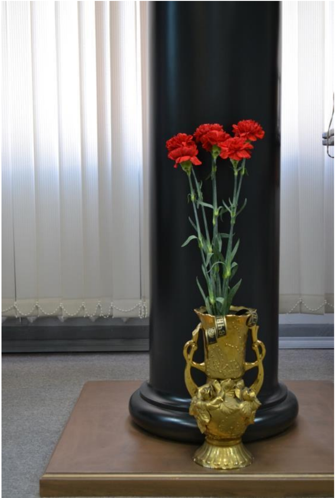
Редактор Матвеева О.В., декабрь 2020 года