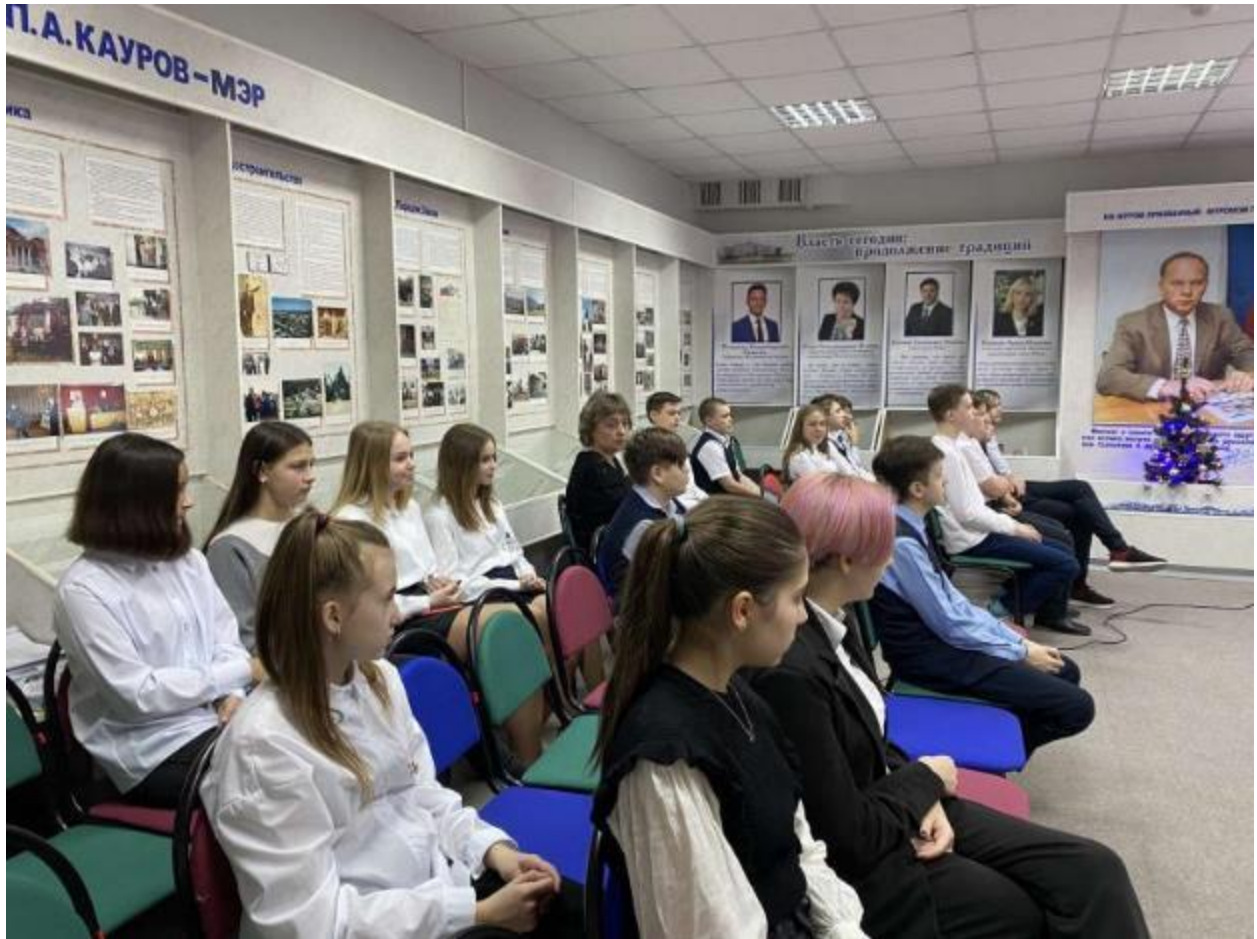
Редактор Матвеева О.В., декабрь 2021